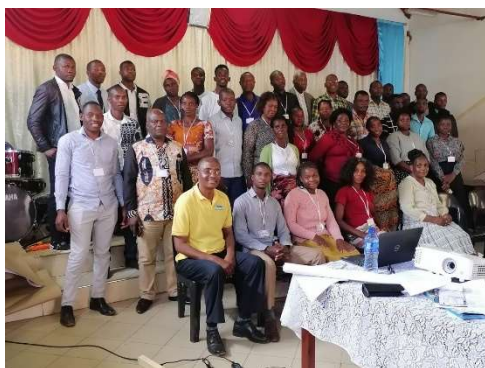
Deltagarna på CCT i Maputo

Som ni säkert vet så har jag en 40% tjänst på SAM och resterande tid är jag på Erikshjälpen. Fokuset i min tjänst på SAM är att stötta våra systerkyrkor i Mocambique, Malawi och Zimbabwe. Det är spännande att regelbundet ha en aktiv och nära kontakt med våra vänner och på olika sätt stötta dem i flera utmaningar de lever med. Trots att jag befinner mig i Sverige känns det som att jag ganska så aktivt kan delta i kyrkornas planer och utveckling. Det optimala hade ju självklart varit att bo och leva i denna region men tyvärr är detta inte möjligt just nu. Det regelbundna fysiska mötet med ledarskapet i dessa länder är dock mycket viktigt och därför planerar jag att genomföra minst två resor per år. I april månad var jag i Malawi och Zimbabwe och i november reser jag tillsammans med en delegation från Sverige till Sydafrika för att möta alla våra systerkyrkor från många delar av världen. Till denna konferens hoppas vi att det kommer representanter från Indien, Hongkong, Japan, Malawi, Eswatini (Swaziland), Zimbabwe, Sydafrika, Mocambique och Botswana.